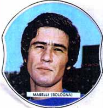
Roma 21-9-1950 Esordio in A. 73-74 ★ Presenze: 30 Reti: 1 ★ Dal Genoa (1974-75)