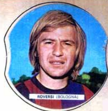
Moglia (MN) 21-3-1947 Esordio in A. 84-85 ★ Presenze: 199 Reti: 2 ★ Dal Moglia (1963-64)