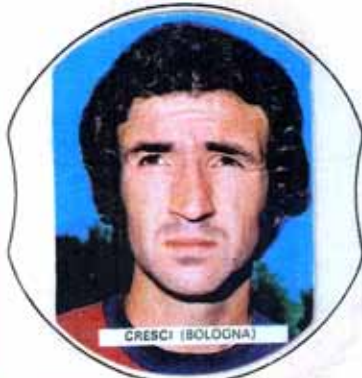
Milano 13-9-1945 Esordio in A. 87-88 ★ Presenze: 201 Reti: 3 ★ Dal Varese (1968-69)