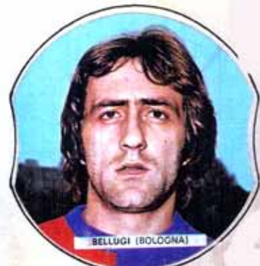
Buonconvento (SI) 7-2-1950 Esordio in A. 69-70 ★ Presenze: 90 Reti: 1 ★ Dall'Inter (1974-75)