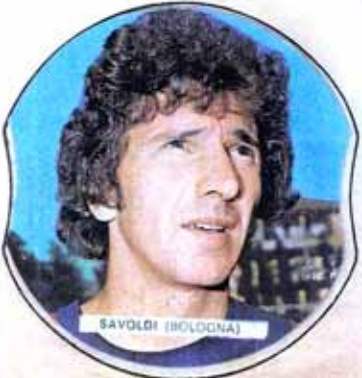
Gorlago (BG) 21-1-1947 Esordio in A. 85-86 ★ Presenze: 230 Reti: 87 ★ Dall'Atalanta (1968-69)