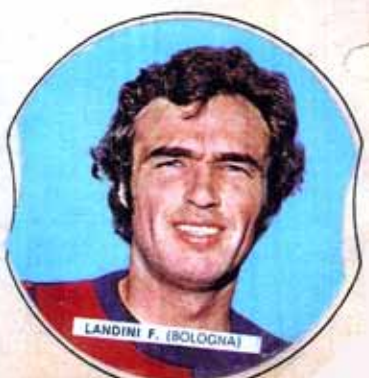
S. Giov. Valdarno (AR) 20-7-1951 Esordio in A. 88-89 ★ Presenze: 102 Reti: 13 ★ Dalla Fiorentina (1974-75)