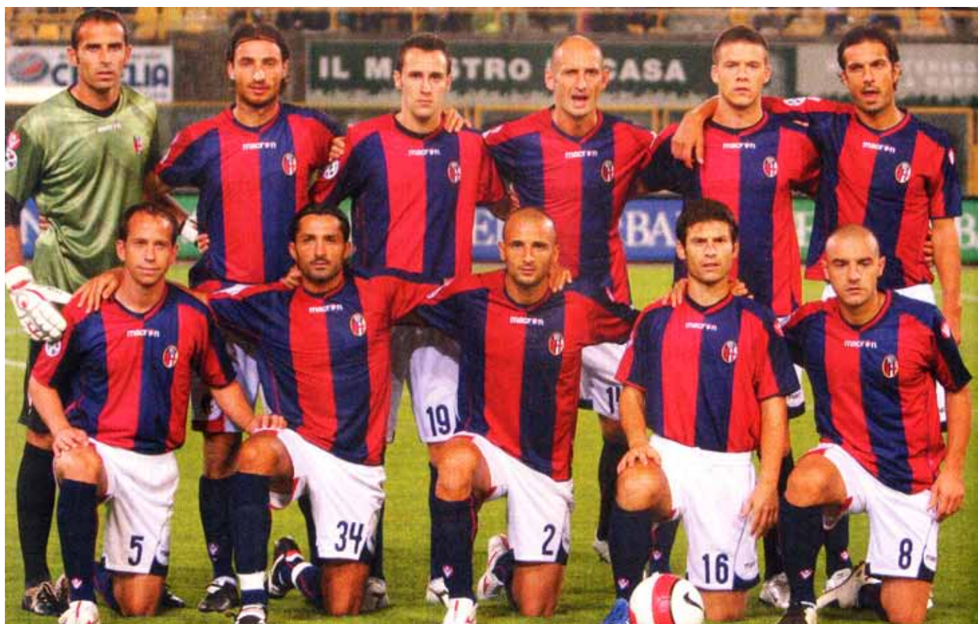
Una formazione del Bologna 2007-08