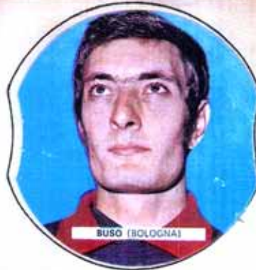
Padova 3-4-1950 Esordio in A. 73-74 ★ Presenze: 79 Reti: 1 ★ Dal Padova (1972-73)

Colori Sociali: Maglia rosso-blu a strisce verticali, calzoncini bianchi, calzettoni blu risvolti rosso.