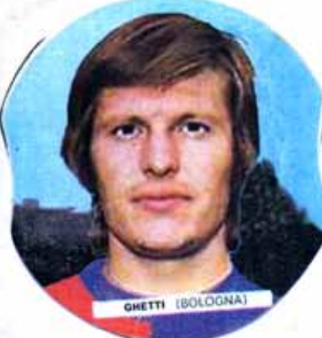
Molinella (BO) 24-7-1951 Esordio in A. 70-71 ★ Presenze: 51 Reti: 9 ★ Cresciuto nella Società