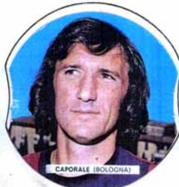
Malmacco (UD) 25-2-1947 Esordio in A. 71-72 ★ Presenze: 45 Reti: 1 ★ Dall'Udinese (1971-72)