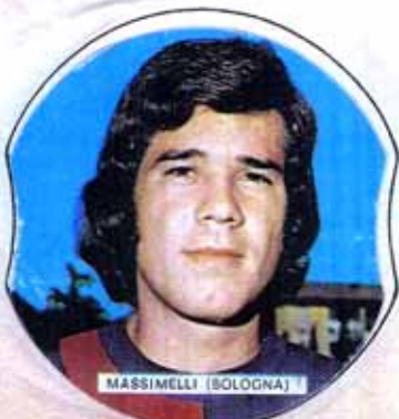
Rivarolo (MN) 27-2-1952 Esordio in A. 71-72 ★ Presenze: 30 Reti: 4 ★ Dal Varese (1973-74)