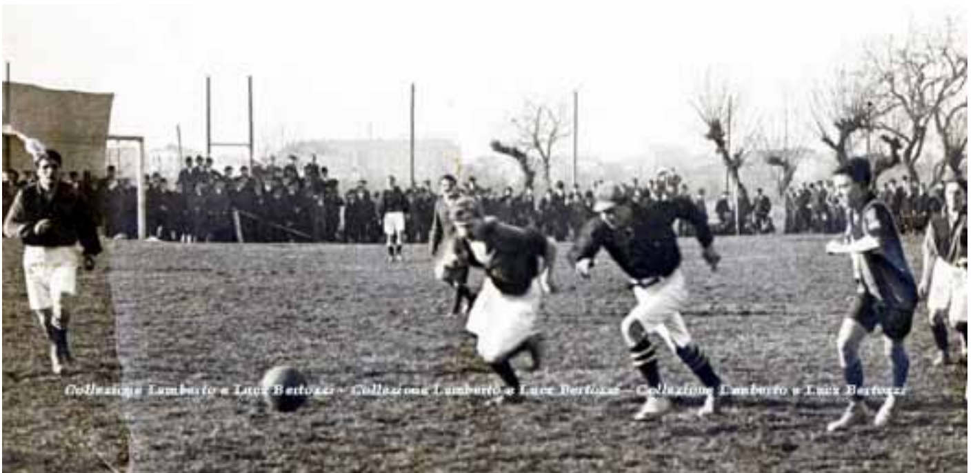
I rossoblu in azione ai Campi di Caprara. (Collezione L. & L. Bertozzi).

I giovani rossoblu si buttarono subito, a capofitto nell'avventura. Iniziarono regolarmente le esercitazioni e gli allenamenti; e ad inizio 1910 si iscrissero al Campionato Emiliano di Terza Categoria. Il 20 marzo 1910, ai Prati di Caprara, si ebbe il debutto della prima