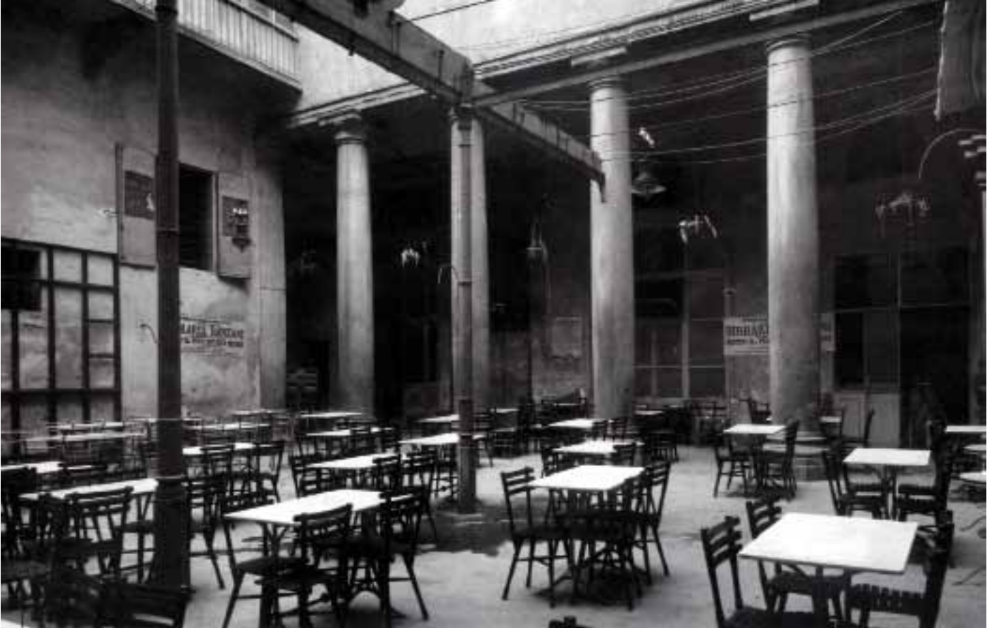
L'interno della "Birraria" Ronzani sita in via Spaderie.

famoso avvocato di Madrid, appena entrato come convittore al Collegio di Spagna, depositario del pallone, acquistato tramite una colletta.