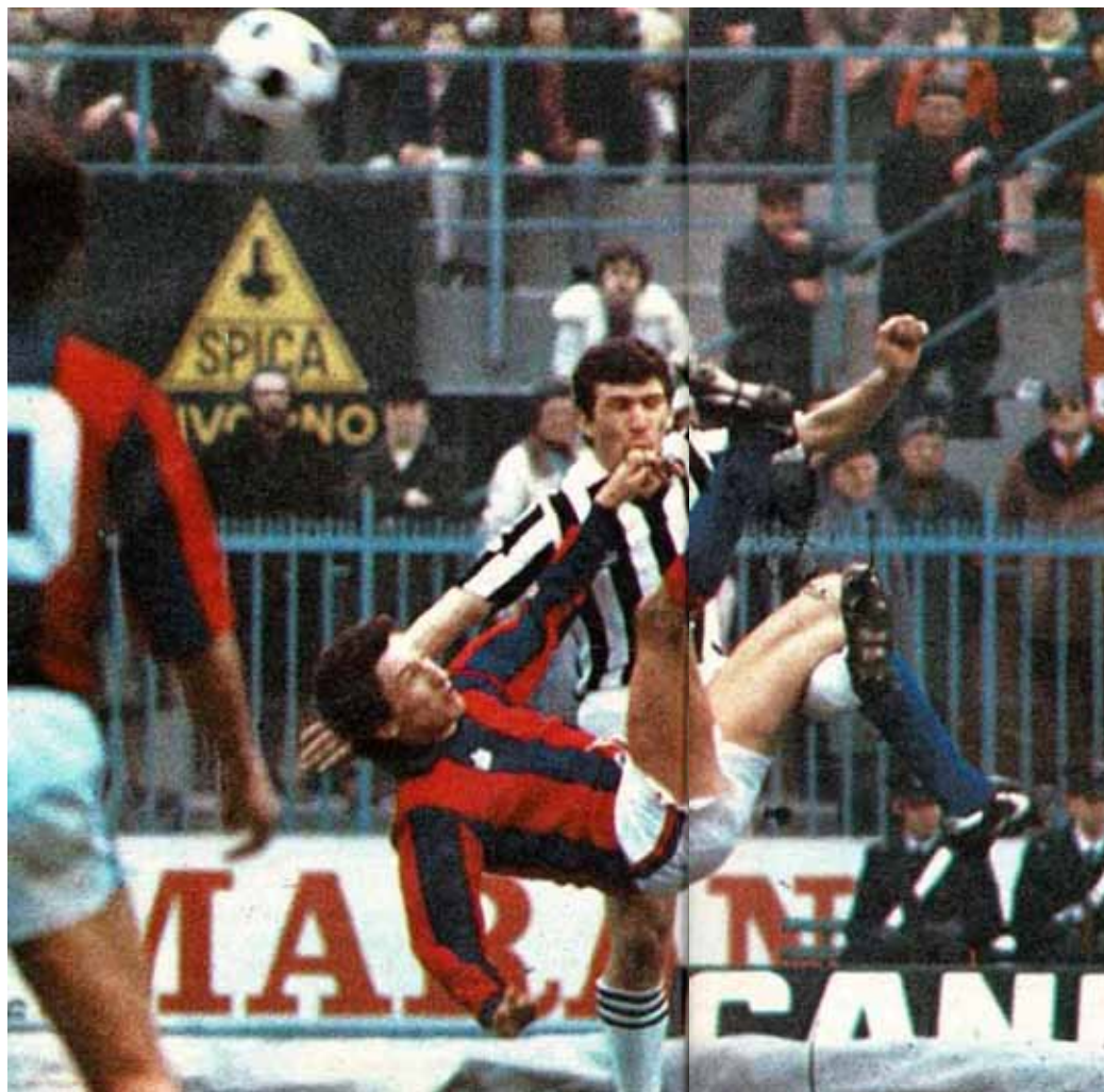
4-2-1979: Bologna-Ascoli 0-0 Bergossi in rovesciata

Un ricordo positivo, crescere in un settore giovanile così importante e qualificato mi ha aiutato nella mia carriera e poi vivere in una città così bella.